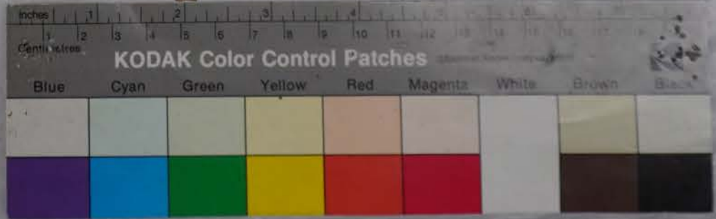
木野愛宕神社所蔵史料 箱 4 - 4 9