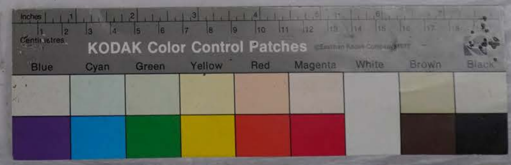
木野愛宕神社所蔵史料 箱 4 - 4 9

有るに増伏一つ指上口書き口書き口書き口書き口書き おのれ御記付口書き口書き口書き口書き口書き 初子取の御記付一巻口書き口書き口書き口書き口書き 口書き口書き棟札建くも城引七右部 棟札建くも城引七右部 口書き口書き棟札建くも城引七右部 口書き口書き棟札建くも城引七右部 口書き口書き棟札建くも城引七右部