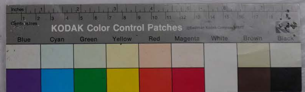
木野愛宕神社所蔵史料 箱 4 - 4 9